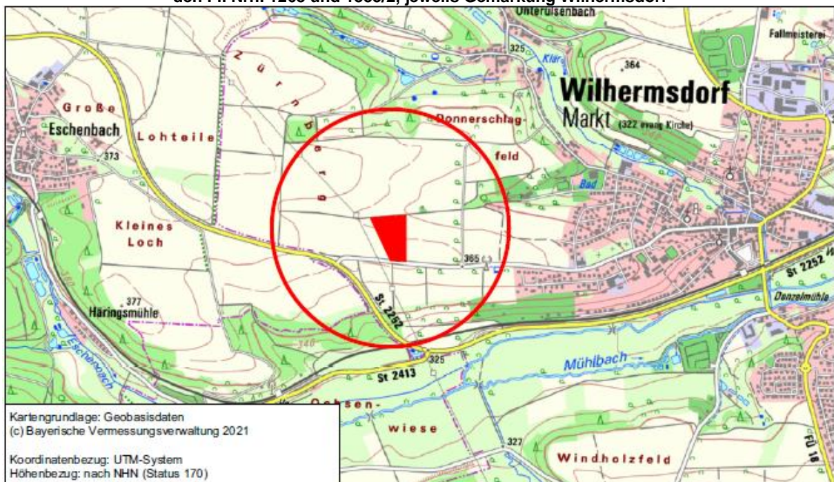
Übersichtslageplan des vorhabenbezogenen Bebauungsplans „Betriebs- und Recyclinghof Enßner“ mit integriertem Grünordnungsplan

Das Grundstück mit der Fl. Nr. 1268/2, Gemarkung Wilhermsdorf, sowie Teilflächen der Grundstücke mit den Fl. Nrn. 1268 und 1355/2, jeweils Gemarkung Wilhermsdorf