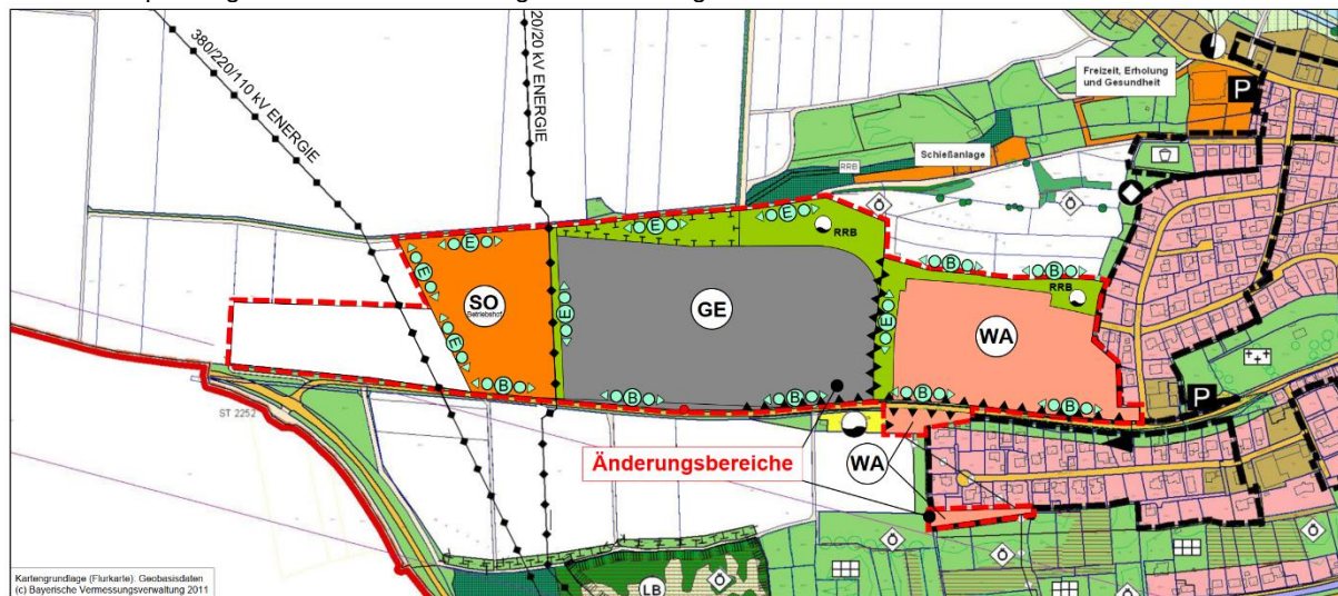
Verkleinerter Auszug aus dem Planblatt zur Änderung des Flächennutzungsplans, ohne Maßstab, © Kartengrundlage Bay. Vermessungsverwaltung 2022, geodaten.bayern.de

Die Gesamtplanungsabsichten stellen sich grafisch wie folgt dar: